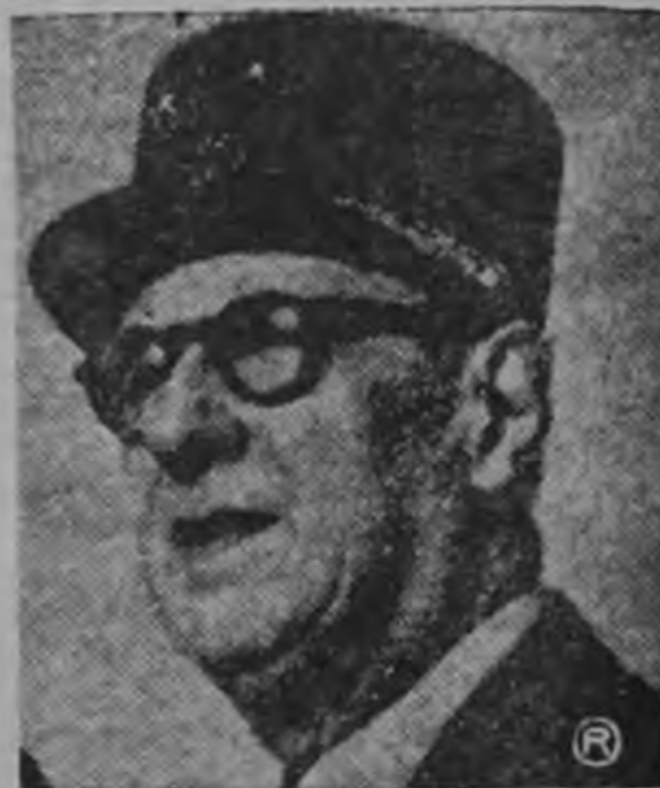
PRESIDENTE DE GAULLE

FRANCIA, 24 (AP) — Los funcionarios franceses dijeron hoy que el Presidente Charles De Gaulle mantendrá los derechos franceses en Alemania aún si retira sus tropas del país.