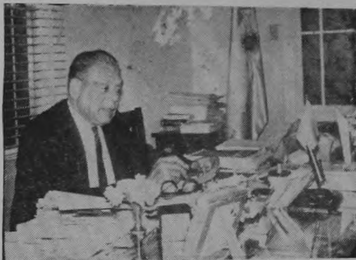
EXCMO. SR. DON G.